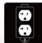
(1) 120V AC 20A 5-20R