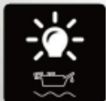
Indicador de Bajo Nivel de Aceite