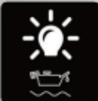
Indicador de Bajo Nivel de Aceite