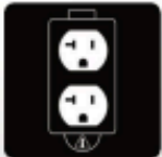
(1) 120V AC 20A Duplex 5-20R