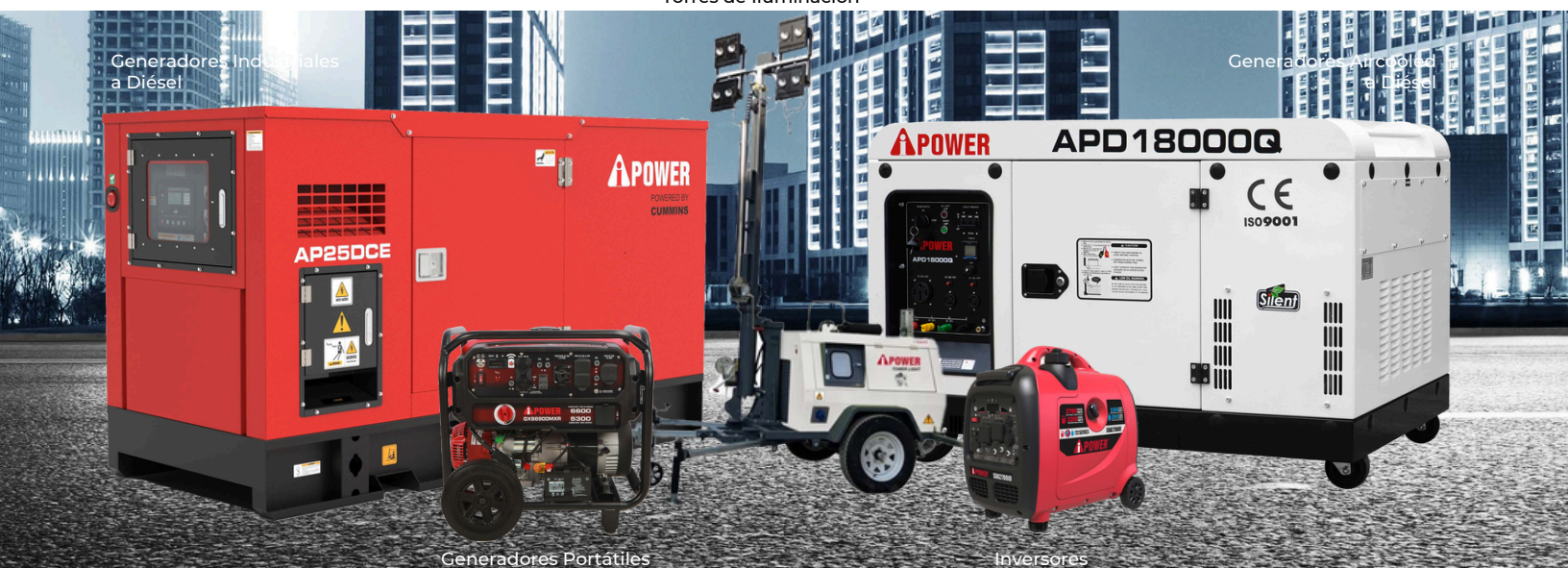
Generadores Industriales a Diésel