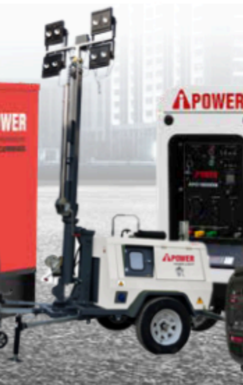
Torres de Iluminación