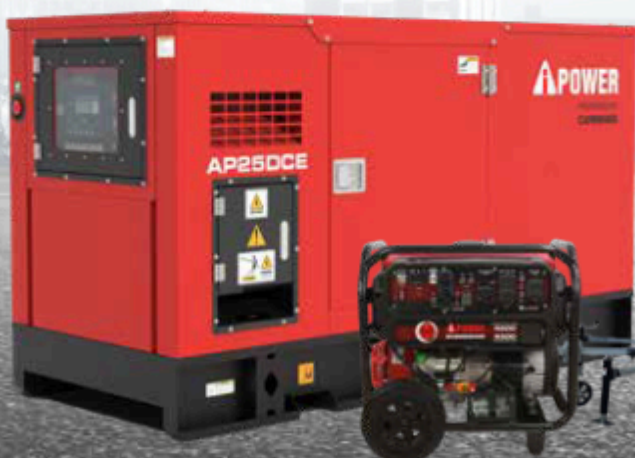
Generadores Industriales a Diésel